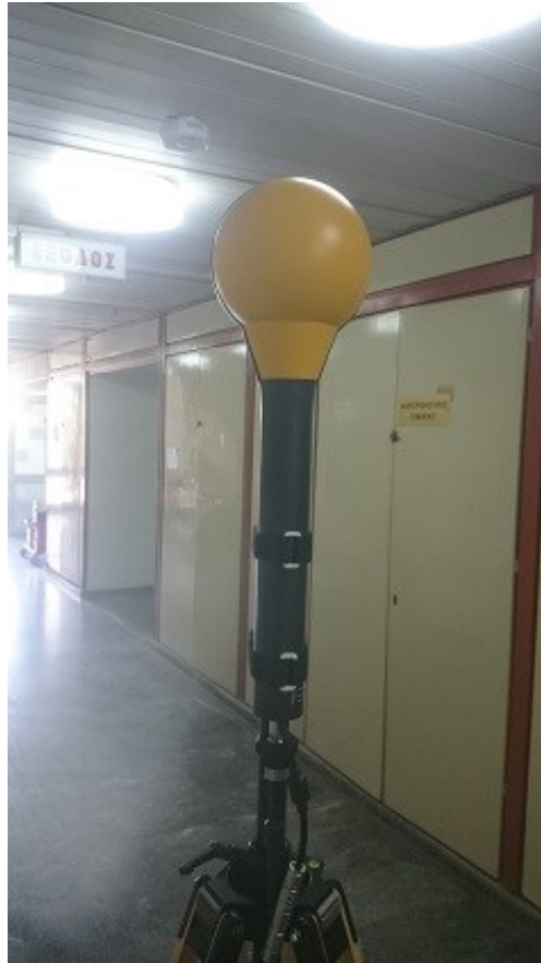
Εικόνα 5. Σημείο Μέτρησης 3.