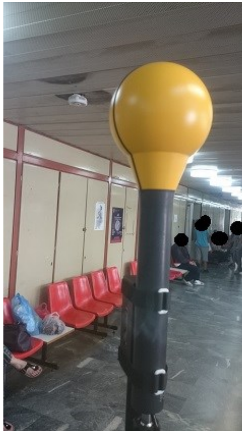
Εικόνα 6. Σημείο Μέτρησης 4.