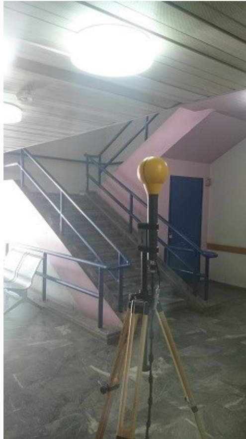
Εικόνα 7. Σημείο Μέτρησης 5.

Για κάθε σημείο πραγματοποιήθηκαν μετρήσεις ανάλυσης φάσματος. Κατά τη διάρκεια της μέτρησης και κατά την επεξεργασία των δεδομένων που λάβαμε έχουν ληφθεί υπόψη όλες οι πηγές ακτινοβολίας του περιβάλλοντα χώρου.