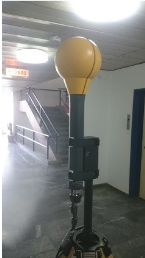
Εικόνα 3. Σημείο Μέτρησης 1.