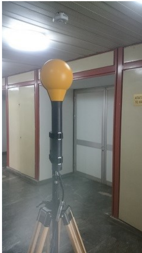
Εικόνα 4. Σημείο Μέτρησης 2.