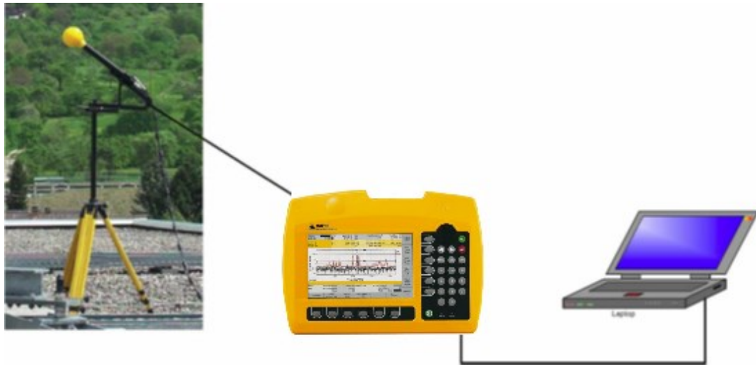
Εικόνα 2. Διάταξη μέτρησης (κεραία / κύρια μονάδα / φορητός υπολογιστής)

Η κεραία τριών αξόνων εγκαθίσταται σε ένα ξύλινο τρίποδο και συνδέεται με την κύρια μονάδα του SRM-3006 μέσω καλωδίου (Εικόνα 2). Οι μετρήσεις πραγματοποιούνται, ρυθμίζοντας κατάλληλα την κύρια μονάδα του SRM-3006 για το είδος της μέτρησης που επιθυμούμε να πραγματοποιήσουμε (π.χ. time analysis ή spectrum analysis) και εν συνεχεία αποθηκεύονται στην κύρια μονάδα.