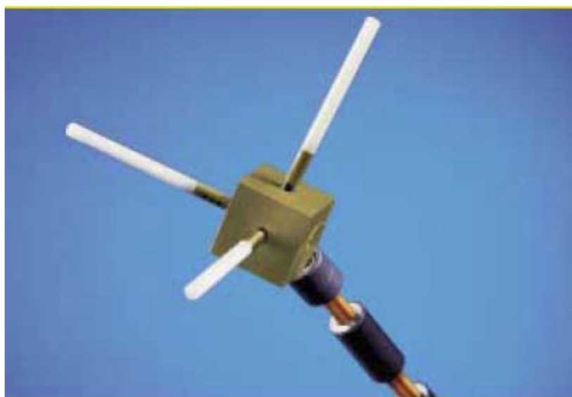
Εικόνα 1. Ισοτροπική κεραία μέτρησης της συσκευής SRM

Η συσκευή SRM αποτελείται από ένα αναλυτή φάσματος (450 MHz – 6 GHz) και μία ισοτροπική κεραία μέτρησης (probe) η οποία χρησιμοποιεί 3 κάθετα μεταξύ τους δίπολα, (Εικόνα 1). Η ισοτροπική κεραία μέτρησης (probe) του SRM μετράει σε 3 κάθετους άξονες ταυτόχρονα.